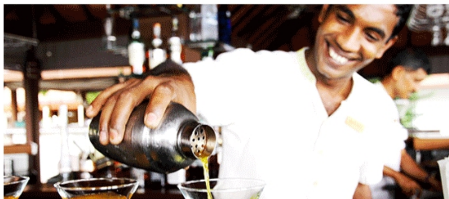
Cocktail Mixology 雞尾酒調酒

節奏快的網球，青春有勁的遊戲。或是和園藝師遊動，與酒店的廚師烹飪。或者您也可以向藝術家學習繪畫或者與調酒師調酒。