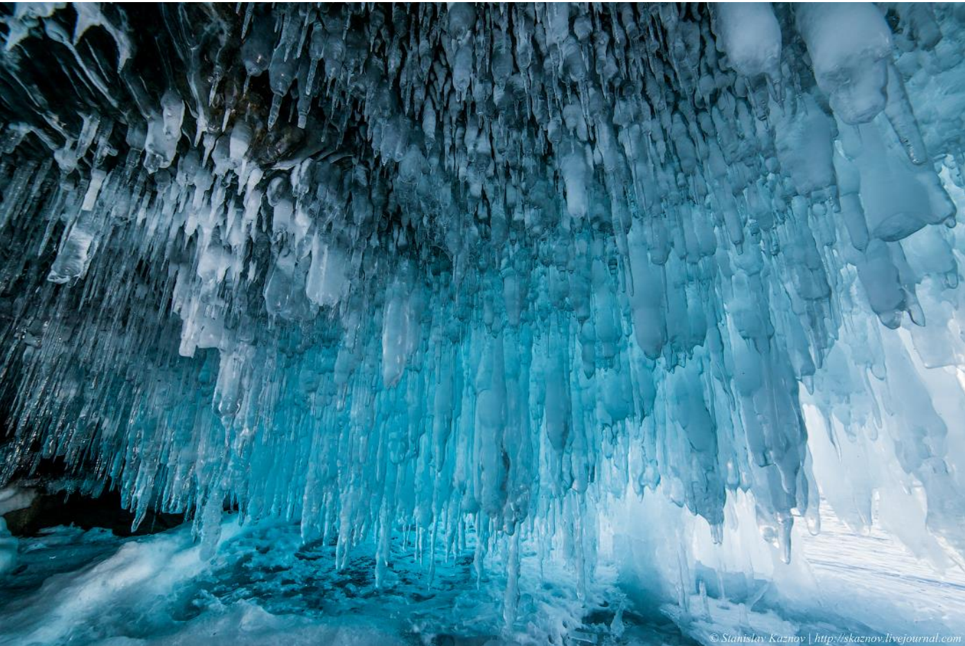
伊爾庫茨克平均氣溫表：（ 僅供參考 ）

在貝加爾湖的 22 個島中，奧利洪島最大，長約 71 公里，寬處有 15 公里，面積 700 多平方公里，人口僅有 1800 多人，大部分是布裡亞特人，它位於湖中部偏北，在湖水最深處附近。奧利洪島就像一顆巨大的珍珠，鑲嵌在貝加爾湖的粼粼波光中，這裡有藍天白雲，惠風綠水。如果說貝加爾湖是西伯利亞的明珠，那麼奧利洪島就是明珠的心臟。