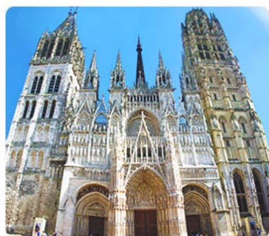
Rouen Cathedral 盧昂大教堂

莫內一系列盧昂大教堂畫作是最佳映證。畫裡大教堂的石頭隨著陽光的投射產生奇妙的顏色變化，彩繪玻璃閃耀著光芒...這裡就是印象派藝術的搖籃！