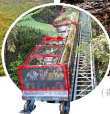
(奇趣鏈纜車+景觀纜車)