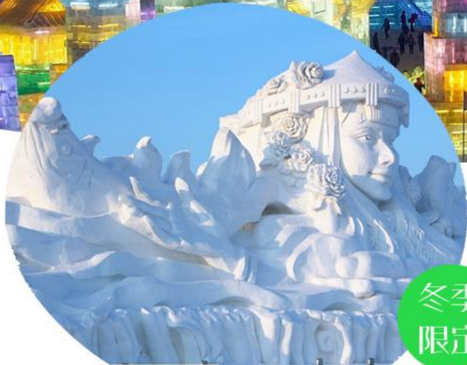
冬季旅遊的最大亮點